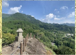
花見ヶ岩公園 英彦山の全景が見られます！