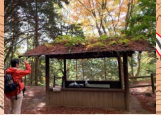
虚空蔵窟 急坂を登ると行ける穴場スポット