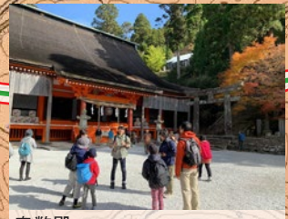
奉幣殿 修験の中心的建造物でした。